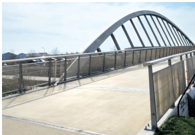
En 2016, une passerelle de 230 m de long, dessinée par l'architecte Marc Mimram, a permis à la Tégéval d'enjamber la RN406 à la hauteur de Créteil et de Valenton.

À terme, la Tégéval devrait prendre la physionomie définitive d'une voie verte de 20 km de longueur pour une superficie de 96 ha, destinée aux piétons, aux personnes à mobilité réduite et aux cyclistes. En connectant les parcs et espaces verts, les transports en commun, les chemins de promenade et les pistes cyclables, cette « coulée verte » a l'ambition de proposer aux Franciliens un nouvel itinéraire pour leurs déplacements quotidiens, plus d'espaces pour les loisirs et le sport, et un accès privilégié à une nature préservée. Tout au long du parcours, des aménagements permettront de profiter pleinement de la nature, tout en préservant la biodiversité.