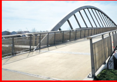
En 2016, une passerelle de 230 m de long, dessinée par l'architecte Marc Mimram, a permis à la Tégéval d'empiéter la RN406 à la hauteur de Créteil et de Valenton.

En 2013, le projet est déclaré d'utilité publique, et les premières réalisations concrètes voient le jour. Trois chantiers sont inaugurés en octobre 2014 à Valenton et à Limeil-Brevannes. En 2016, dessinée par l'architecte Marc Mimram, une passerelle de 230 m de long enjambe la RN406 à la hauteur de Créteil et de Valenton. Actuellement, selon le site Internet de la Tégéval, « 4,5 km sont déjà aménagés et 7 km sont accessibles. Les aménagements s'achèveront dans une quinzaine d'années, mais, dès 2020, l'intégralité du parcours sera accessible. »