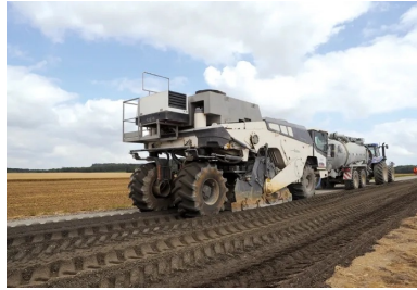
L'atelier de retraitement avec une citerne à eau asservie.

Lancés le 11 juin, les travaux préalables au retraitement en place se sont déroulés du 11 juin au 9 juillet, sous circulation alternée, sur le tronçon concerné, long de 6 km (en deux tranches). À compter du 9 juillet, la circulation a été totalement déviée pour permettre le retraitement en place.