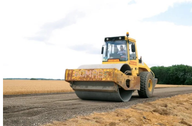
L'atelier de compactage composé d'un « vibrant » (un cylindre monorouleur V5) et d'un « pneu » (un PS 300).