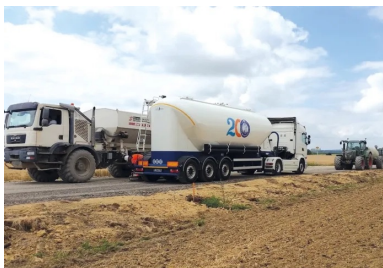
À l'occasion du bicentenaire de l'invention du ciment artificiel par Louis Vicat, les livraisons ont été effectuées par des porteurs spécialement dédiés.