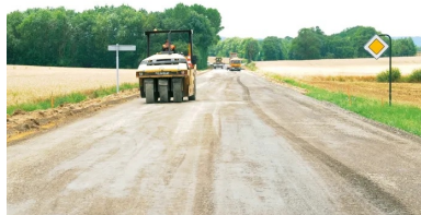
L'atelier de compactage composé d'un « vibrant » (un cylindre monorouleur V5) et d'un « pneu » (un PS 300).

La fin des opérations de retraitement était planifiée pour le 17 juillet. Bilan : superficie globale concernée : 45 000 m 2 . Quantité totale de liant LVT5 54 de Vicat mis en œuvre : environ 1 000 t. « Pour ce chantier, le retraitement en place au liant hydraulique routier est une solution intéressante qui permet de reprendre la structure dans son intégralité », résume Stéphane Dir, en charge de l'entretien routier. « Les conditions nécessaires à la réussite d'une telle opération à forts enjeux sont les suivantes : implication totale de l'ensemble des acteurs de l'opération (maîtrise d'ouvrage, maîtrise d'œuvre, entreprise, contrôle externe et extérieur...), définition de points d'arrêt pertinents permettant de garantir un travail de qualité et maîtrise des