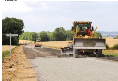
Passage de la niveleuse pour un bon uni et le meilleur profil géométrique possible.