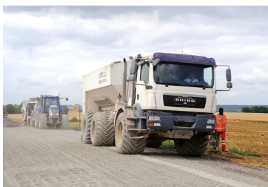
Épandage du liant hydraulique routier LVTS 54 de Vicat et vérification de la bonne répartition du liant au mètre carré (méthode dite « à la bêche »).