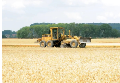
Passage de la niveleuse pour un bon uni et le meilleur profil géométrique possible.

Enfin, après le malaxage permettant d'obtenir une structure homogène, nouvelle intervention de la niveleuse visant à donner un bon uni et le meilleur profil géométrique possible. Après cette étape importante de l'exécution, qui nécessite du « savoir-faire » de la part du conducteur, place à l'atelier de compactage pour obtenir la densité recherchée. Composé d'un compacteur vibrant type V5 et d'un compacteur à pneus type PS 300, l'atelier de compactage avait pour mission d'obtenir la portance recherchée (PF3 à 3 jours, PF4 à 7 jours). « Nous avons réalisé une planche d'essai longue de 50 m en début de chantier, explique un technicien. Elle nous a permis de constater que la bonne densité serait obtenue grâce à 4 passes de compacteur V5 et 6 passes de compacteur PS 300. »