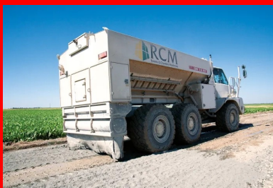
L'épandeur à liant de RCM.