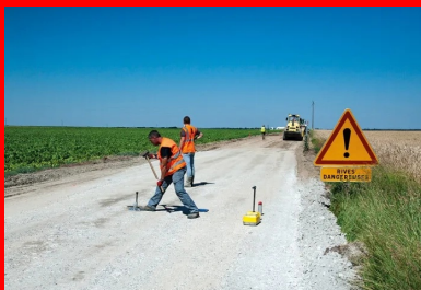
À droite, contrôle de la régularité de l'épandage et de la quantité des liants réalisé par la méthode dite « à la bêche ». À gauche, préparation d'un test de compacité. En médaillon, résultat à l'issue du malaxage : le liant clair a été finement mélangé avec le matériau de l'ancienne chaussée.