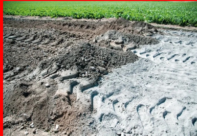
Résultat à l'issue du malaxage : le liant clair a été finement mélangé avec le matériau de l'ancienne chaussée.