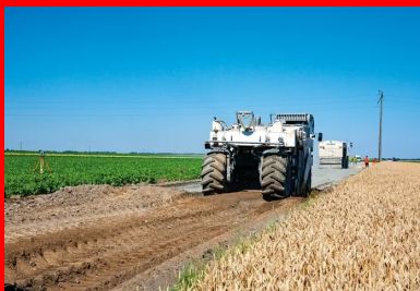
Le malaxeur Wirtgen 2400 intervenant sur une épaisseur de 45 cm de profondeur.

« Lorsque les poids lourds se croisaient, poursuit Gérard Gaisnon, il y avait des détériorations en rives, les camions passant sur les accotements et provoquant des effondrements. » À l'étude depuis « trois ou quatre ans », une opération de rénovation est finalement décidée début 2018. En plus du remplacement du revêtement, la solution de base proposée par la direction des routes de Seine-et-Marne consiste en un élargissement (passage d'une largeur de 5,80 à 6,20 m avec une reprise d'1,50 m de chaque côté) et en un renforcement de la chaussée par réfection des poutres de rives sur une longueur d'un peu moins de 3 km. Réalisable par demi-chaussée, l'opération implique une mise en décharge des anciens matériaux.