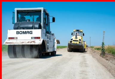
L'atelier de compactage composé d'un compacteur à pneumatiques Bomag BW 24 RH et d'un rouleau V5.

L'étape préalable au retraitement, la fragmentation, consistant à transformer le corps compact de la chaussée en un matériau granulaire, est achevée. « La surface a été rabotée, générant environ 14 000 m 2 de fraïset d'enrobé, commente encore le directeur général de RCM. Il va être reconditionné avec du liant hydraulique pour élargir la voie et servir de couche de base à la nouvelle route. Le traitement s'effectue sur une largeur de 7,20 m, ce qui permet d'augmenter la largeur totale de la chaussée jusqu'à 6,20 m et de stabiliser aussi les bas-côtés. »