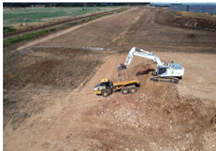
↑ Les terrassements ont permis la réalisation d'un remblai « d'une hauteur de 7 m ».

Cette planche d'essai complète les études de traitement menées en phase de préparation et en cours de chantier. Quelques dizaines d'éprouvettes ont été réalisées, pendant le premier confinement du Covid-19, par le laboratoire de l'entreprise, puis conservées 7-28-90 jours à une température constante et à une hygrométrie contrôlée pour mesurer les performances mécaniques (couple Rt/E en MPa). « C'est le dosage à 4,75 % qu'a retenu RCM », conclut Jaouad Nadah.