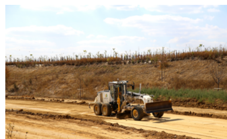
⤴ Phase très importante, la recoupe finale garantit un bon réglage.

« Lors du malaxage, nous ne voulions pas que des matériaux non traités restent à l'interface de la PST et de la CDF. Notre conducteur de malaxeur a donc systématiquement repris 1-2 cm du traitement de la PST pour s'assurer de la parfaite liaison des deux couches »