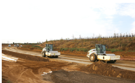
⤴ Les deux compacteurs V5 de l'atelier de compactage.