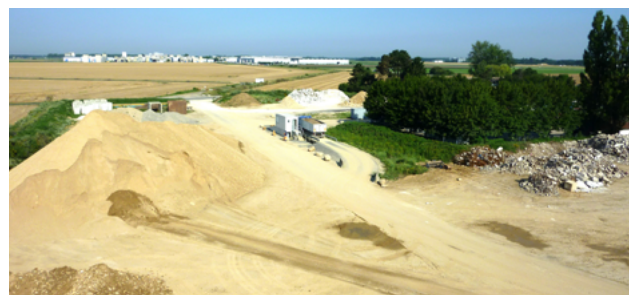
↑ La zone de stockage de la plate-forme avec différents matériaux (sables, gravillons, déblais...).