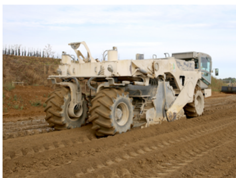
⤴ Le malaxage a été effectué à l'aide de la stabilisatrice Wirtgen 2400. Pour s'assurer de la bonne interface PST-CDF, 1-2 cm du traitement de la PST a été systématiquement repris.