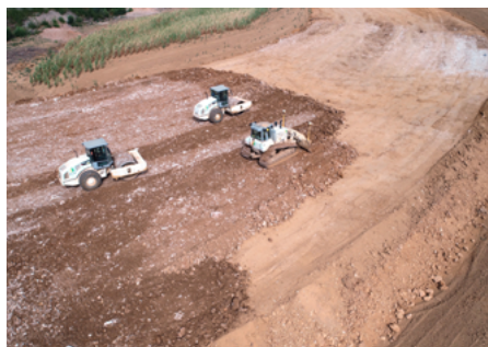
▲ Vue d'ensemble des travaux de réalisation du remblai, par couches successives.

« 90 % du parc des machines de terrassement sont asservis GPS, 100 % des machines de réglage sont équipées en ATS (système de suivi dynamique de haute précision) », précise Roger Meschin, directeur du matériel. De son côté, Pierre Stoquert, directeur d'exploitation, ajoute : « Nos conducteurs d'engins appliquent une procédure d'entreprise pour la vérification des points de contrôle que notre géomètre-topographe enregistre à chaque début de chantier sur trois ou quatre plots disposés sur le chantier. »