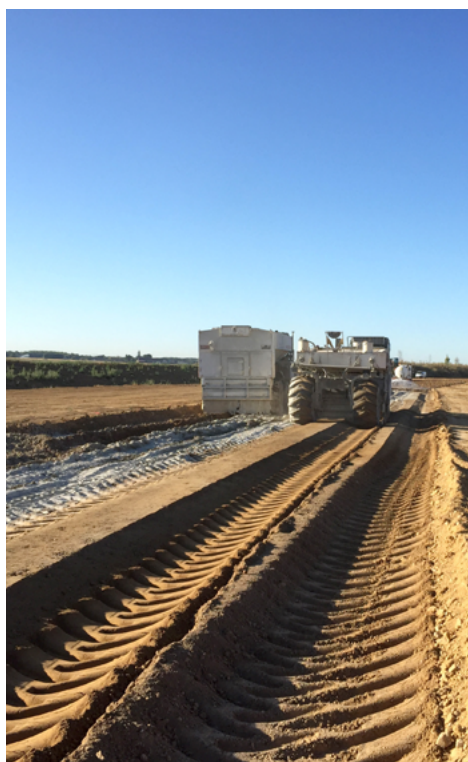
⤴ L'épandage du liant hydraulique routier ROC VDS d'EQIOM à raison de 4,75 % (soit plus de 29 kg/m 2 ).

L'opération de traitement, proprement dite, y a succédé. Elle a été réalisée en deux phases successives : un épandage du liant hydraulique routier à raison de 4,75 % de ROC VDS (soit plus de 29 kg/m 2 ) à la surface du matériau à l'aide d'un épandeur à dosage asservi à l'avancement, suivi d'un malaxage à l'aide de la stabilisatrice Wirtgen 2400. « Lors du malaxage, nous ne voulions pas que des matériaux non traités restent à l'interface de la PST et de la CDF. Notre conducteur de malaxeur a donc systématiquement repris 1-2 cm du traitement de la PST pour s'assurer de la parfaite liaison des deux couches », précise Yoann Ausanneau.