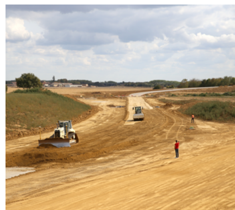
⤴ Réglage et compactage.